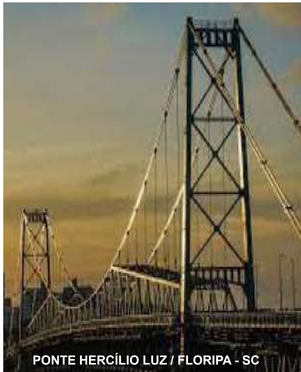
PONTE HERCÍLIO LUZ / FLORIPA - SC